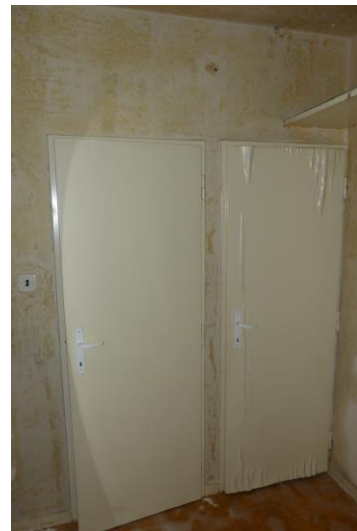
Vstup – koupelna, WC