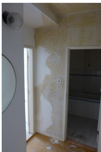
Zádveří – vstup do koupelny