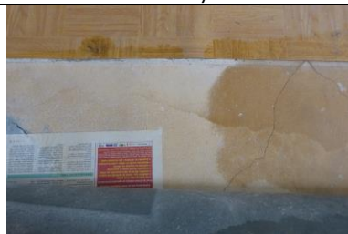
Podlaha v kuchyni