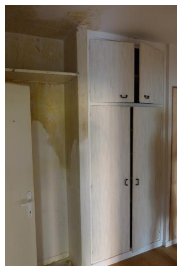
Zádveří – vestavná skříň